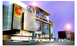
Imperial World Samrong