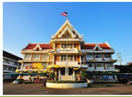
ศาลากลางจังหวัดสมุทรปราการ